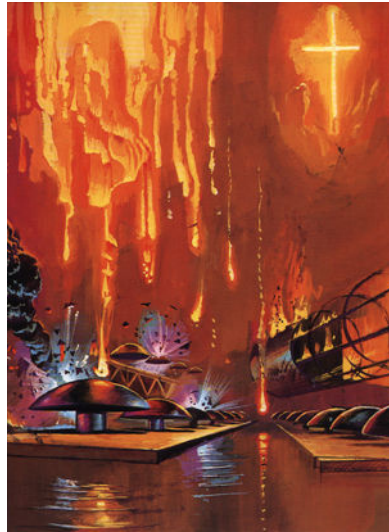
figura n.5 bis: